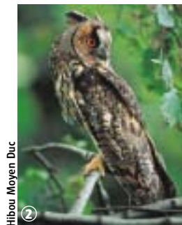
Hibou Moyen Duc