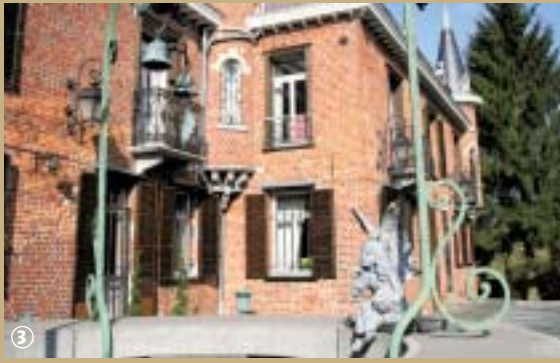
La licorne, emblème du village