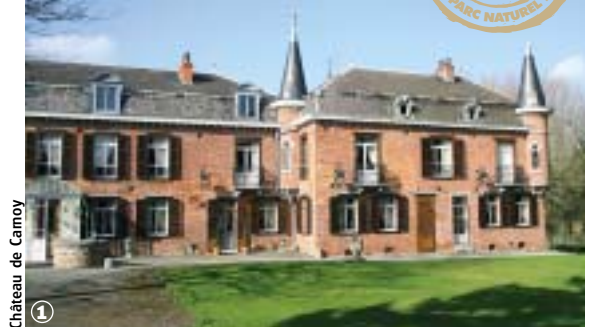
Château de Camoy