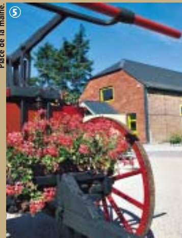
Place de la mairie.

un Saint, témoignent de l'importance du culte dans le village. Un culte plutôt païen, cette fois, accompagne la croyance selon laquelle l'eau de la fontaine Saint-Clément pouvait guérir les névralgies, maux de dents et d'oreilles. Malgré ces protections divines, Frasnoy ne fut guère épargnée par les conflits mondiaux comme nous le remémore le cimetière allemand, dernière demeure de plus de 4 477 victimes de la Grande Guerre ; alors qu'au cimetière communal repose Emile Bigorne, soldat de la Guerre 1914-1918, devenu héros local pour ses faits d'armes.