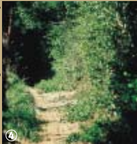
« Cache » (sentier bocager) autour de Frasnoy.

régional de l'Avesnois et à la lisière de la forêt de Mormal, il y fait tout simplement bon vivre.