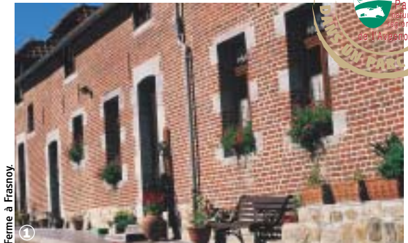
Ferme à Frasnoy.