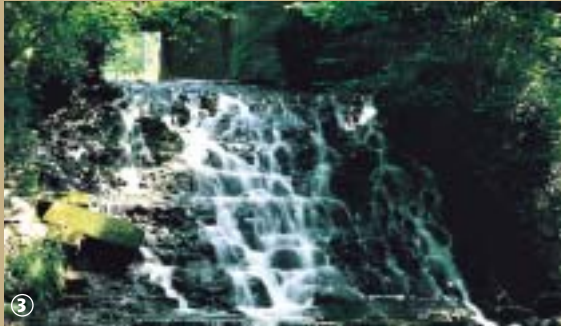
Cascade de Quélipont.

seconde moitié du XIX e siècle et justifiant l'exploitation de la betterave sucrière. L'église Saint-Clément reconstruite en 1857 et trois chapelles dédiées chacune à