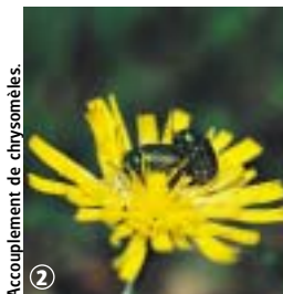
Accouplement de chrysothèmes.