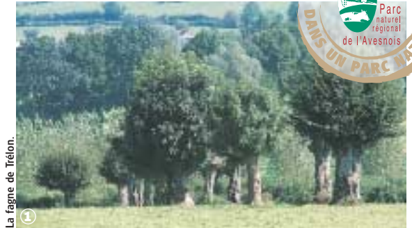
La fagne de Trélon.

Randonnée Pédestre Sentier « Nature et Paysage » : 4 km