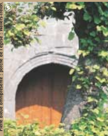
Pierre bleue omniprésente : porche de l'église - Wallers-Trélon.

gnant ce paysage composé de landes, marécages et forêts de Hêtres (fagus en latin). Cette antenne de l'Ecomusée régional œuvre pour la postérité et témoigne des métiers relatifs au travail de la pierre. Un sentier découverte jalonné de bornes, conduira les visiteurs sur les traces des tailleurs de pierre bleue.