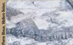
Pierre Bleue, Wallers-Trélon.

gnant ce paysage composé de landes, marécages et forêts de Hêtres (fagus en latin). Cette antenne de l'Ecomusée régional œuvre pour la postérité et témoigne des métiers relatifs au travail de la pierre. Un sentier découverte jalonné de bornes, conduira les visiteurs sur les traces des tailleurs de pierre bleue.