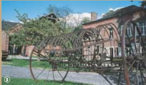
Maison du Bocage, Sains-du-Nord.

N'hésitez pas, c'est la Maison qui régale ! Ce genre de voyage au cœur des activités traditionnelles de l'Avesnois se poursuit dans les autres structures qui composent