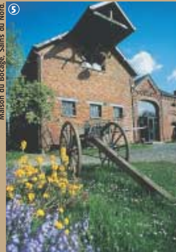
Maison du Bocage, Sains du Nord.

l'étable. Ici prime l'authenticité ! Au travers d'expositions vivantes et de reconstitutions d'ateliers artisanaux, se dessine l'histoire du bocage avesnois, de ses origines à nos jours. Ici se dévoile un milieu à la fois complexe, par la diversité des arbustes qui composent la haie et la faune qui en dépend ; mais aussi fragile car son entretien est difficile. Sa vocation est elle agricole. L'exploration du bocage se révèle être un véritable hymne à la vie, qu'entretient la Maison lorsqu'elle