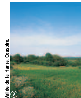
Vallée de la Hante, Coulsore.

Les informations mentionnées couvrent un périmètre de 10km.