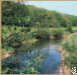
Vallée de la Hante, Coulsore.

Au cœur de l'Avesnois, entre pâturages et rivières, les chemins ondulent entre la France et la Belgique et laissent entrevoir un patrimoine bien caché. Les amateurs d'art seront peut-être surpris d'apprendre que certaines cheminiées du Château de Versailles furent réalisées dans les marbreries locales, Coulsore ayant longtemps