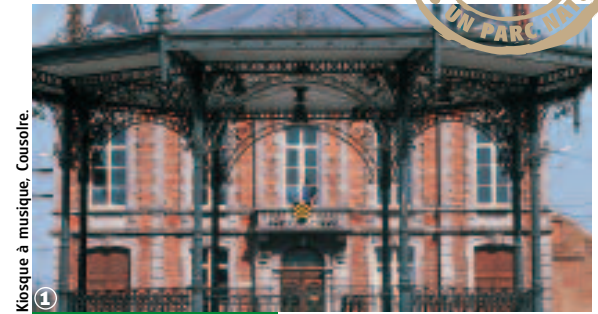
Kiosque à musique, Coulsore.