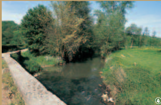
Pont courroux sur la Hante.