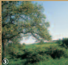
Vallée de la Hante, Coulsore.

vécue de l'exploitation des carrières marbrières. Coulsore, ville bénit par les rois puisque Charlemagne s'y serait rendu en pèlerinage. D'autres édifices témoignent de la piété de la ville, comme un presbytère de 1621, une chapelle du XVI e siècle, la Chapelle du Dieu de piété et surtout l'église Saint-Martin, à l'intérieur de laquelle deux statues en bois représentent les parents de Sainte-Aldegonde. Les amoureux de la nature et de la pêche seront, quant à eux, ravis du