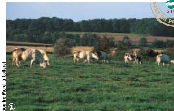
Gouffre Morel à Colleret