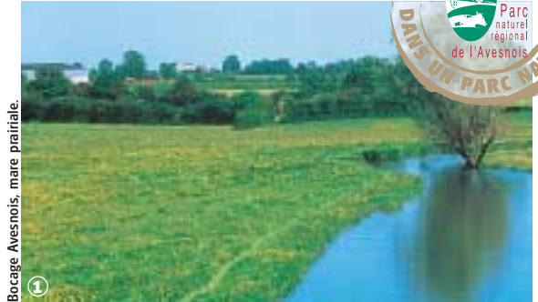
Bocage Avesnois, mare prairiale.

Randonnée Pédestre Circuit des Chapelles-Colonnes : 12,5 km