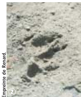
Empreinte de Renard.