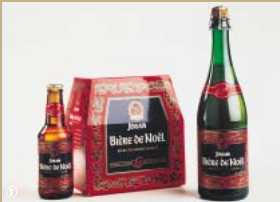
Bière de Jenlain.

Longtemps connue pour sa fabrication de boutons, la réputation de la commune de Jenlain a largement dépassé les frontières de l'Avesnois, grâce à la célèbre bière éponyme. La boisson ne serait-elle pas d'ailleurs plus célèbre que le village lui-même ? ! C'est en 1922 que Félix Duyck, brasseur à Zeggens-Cappel rachète une ancienne brasserie à Jenlain. Il y fabrique une bière de garde ambrée, largement appréciée des consommateurs locaux, principalement des paysans. Conditionnée en fûts de bois uniquement, cette « vieille bière » ou « bière de garde » comme on l'appelait à l'époque, ne fut mise en bouteille qu'à l'orée des années 1950. A la fin des années 1960, un épicier lillois décide de la commercialiser et elle rencontre un franc succès auprès des étudiants de l'Université catholique. Dès lors, elle