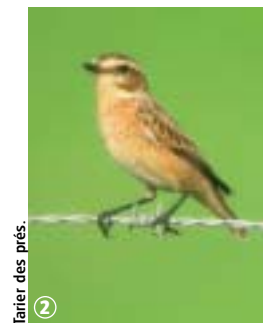
Tarier des prés.