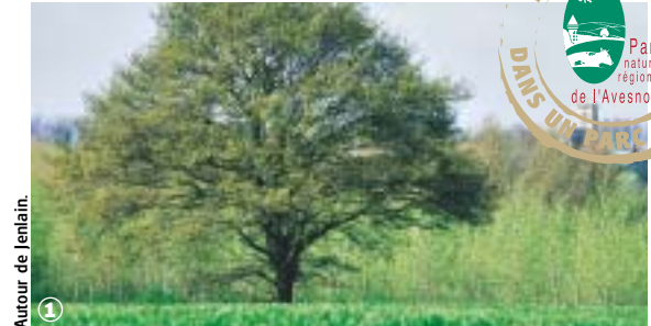
Autour de Jenlain.