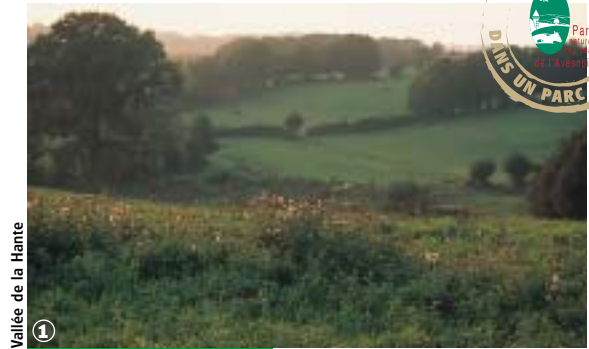
Vallée de la Hante