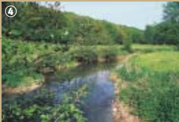
Vallée de la Hante, Couslore.