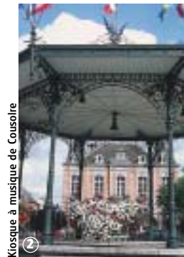
Kiosque à musique de Couslore