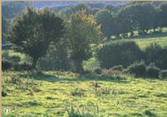
Autour de Reugnies

Le village de Bousignies-sur-Roc, jadis hameau de Couslore étagé sur les pentes de la Hante, renferme en son sol minerais de fer et quartzites et on y connut jadis des marbreries.